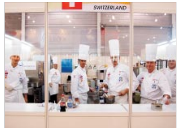
Singapur. Dienstag, 25. April im Messegelände: Nach wenigen Stunden Schlaf, um vier Uhr morgens, verpackt unsere Kochnationalmannschaft ihre Utensilien und die Lebensmittel für den 35-minütigen Transport ins Messegelände. In der Messe, hinter Glasfenstern, richtet sie die Schauküche ein. Von 7 bis 11.30 Uhr kocht das Team ihr Dreigangmenü für 80 Personen.