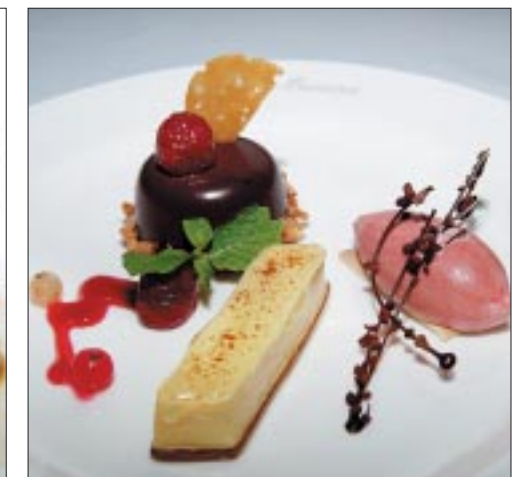
Dessert: Mandelbiskuit und eine Mousse aus Passionsfrüchten, Quarkkuchen und Johannisbeerbjoghurtglace.