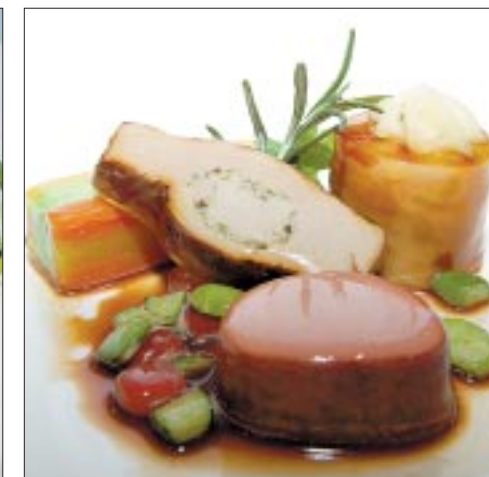
Hauptspeise: Gefüllte Kalbsbrust mit Milken, Kalbsfilet, Kartoffeln mit Trüffeln, Saubohnen, Pfälzerkarotten, Tomaten und Erbsen.