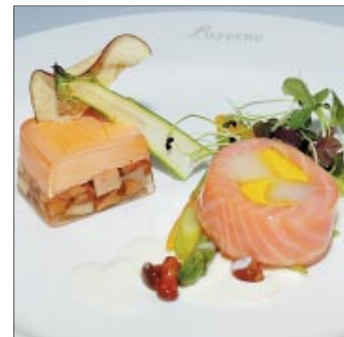
Vorspeise: Entenlebermousse mit Eierschwämmen und Apfelmarmelade, Lachs- und Zanderfilet mit Jakobsmuscheln, Spargelchips.